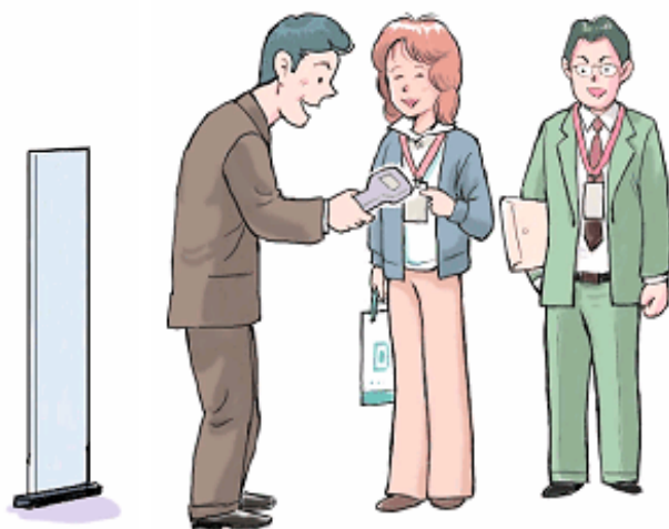
図2. ハンディタイプ