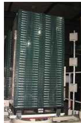
洗浄センターでの一括読取りの様子