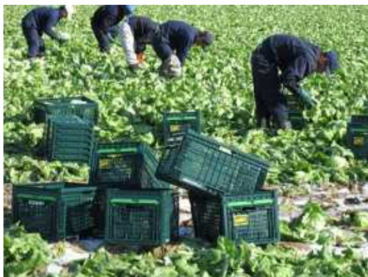
RFIDタグ付レンタルコンテナを使った圃場での収穫の様子