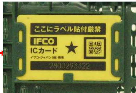
コンテナに装着するRFIDタグ