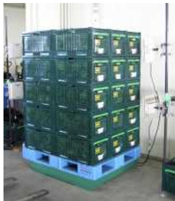
集出荷場での受入時の読取りの様子