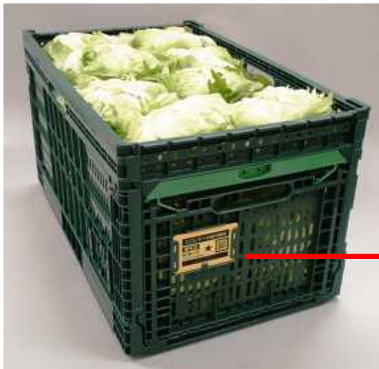
RFIDタグ付レンタルコンテナ

短側面にRFIDタグ取付用のポケットを装備し、コンテナ生産段階でRFIDタグを装着。生産地でRFIDタグを装着する手間なく収穫作業が行えます。生産地での収穫作業や輸送時の衝撃、コンテナの洗浄に対しても壊れない耐久性を備えています。